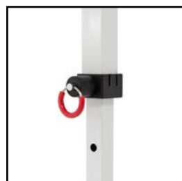
Uniones de nylon de alta densidad