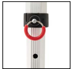
Uniones de nylon de alta densidad